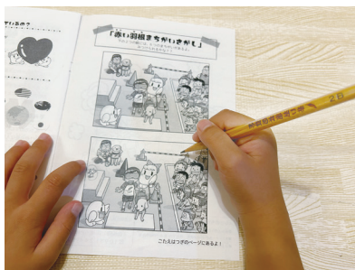
新小学1年生への学用品贈呈へ