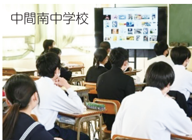
中間南中学校 市内の小中学校の福祉教育推進へ