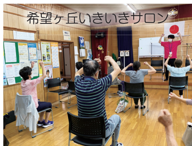
ふれあい・いきいきサロンへ