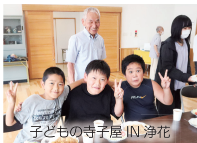
子どもの寺子屋 IN 浄花 地域で活動しているボランティア団体へ